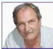
Por Eduardo E. Eraso, Editor.

Aprovechando la extrema debilidad de las entidades y el fuerte