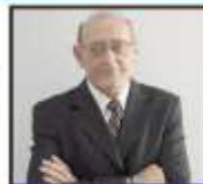
Por Domingo Ramos Bravo.

Lo cierto es que, al día de hoy, estamos estancados en las mismas discusiones de siempre, comentado los errores cometidos por unos y otros, asignándole responsabilidades a nombres propios; y, la discusión, la crítica constructiva, el reconocer ¿qué? Es el causal de