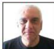
Por Osvaldo Beard, Diario del Mercado Digital.

grasas, típica de los humanos en aquel país así como en otras naciones industrializadas. Una vez obtenido el alimento, se le asignó una ración de esta comida a unos ratones que no poseían la capacidad de eliminar el colesterol malo de su sangre y que inexorablemente desarrollaban inflamación y aterosclerosis cuando consumían una dieta rica en grasas. Los tomates enriquecidos con ese péptido representaron el 2,2% de la dieta asignada a los roedores.