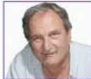
Por Eduardo E. Eraso, Editor.

Adhirieron a esta actividad organizada por COMAFRU del Mercado