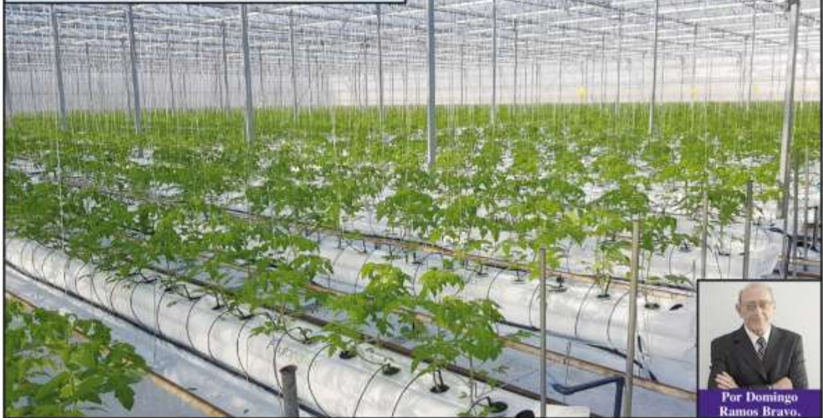
Por Domingo Ramos Bravo.

A vanza despacio, pero firme, la idea de producir en sistema hidropónico, cada vez más personas consultan sobre estos temas. El alimento cotidiano es un tema que ocupa y preocupa a los seres humanos. En los últimos años, las complicaciones para producir se han ido agravando. Cambio climático, que afecta directamente sobre los ciclos de cultivos y sus varietales, como la temperatura, humedad y componentes de los suelos; los cambios en las políticas institucionales, relacionadas al sistema productivo y distributivo, los condicionamientos de los mercados de distribución, transportes, y, lo más grave, la falta de personas que se dediquen a tareas relacionadas con los quehaceres propios de la actividad. Existen, además, otros tantos temas que acompañan a las desesperanzas de los que producen, y que en nada acompañan a las leyes de la naturaleza.