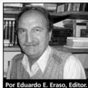
Por Eduardo E. Eraso, Editor.

E sta es la última edición de Diario del Mercado en papel, justo en la edición 303 y con 25 años de publicación.