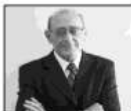
Por Domingo Ramos Bravo. www.domingoramosbravo.com.ar

Los ciclos de indefiniciones, de intereses "de poder, de inoperancia, de desconocimiento" o simplemente por ignorancia del resto de los ciclos, se van destruyendo los relojes de "otra nueva oportunidad" poco a poco los ciclos de las posibilidades de crecimiento y desarrollo, van apagando sus relojes.