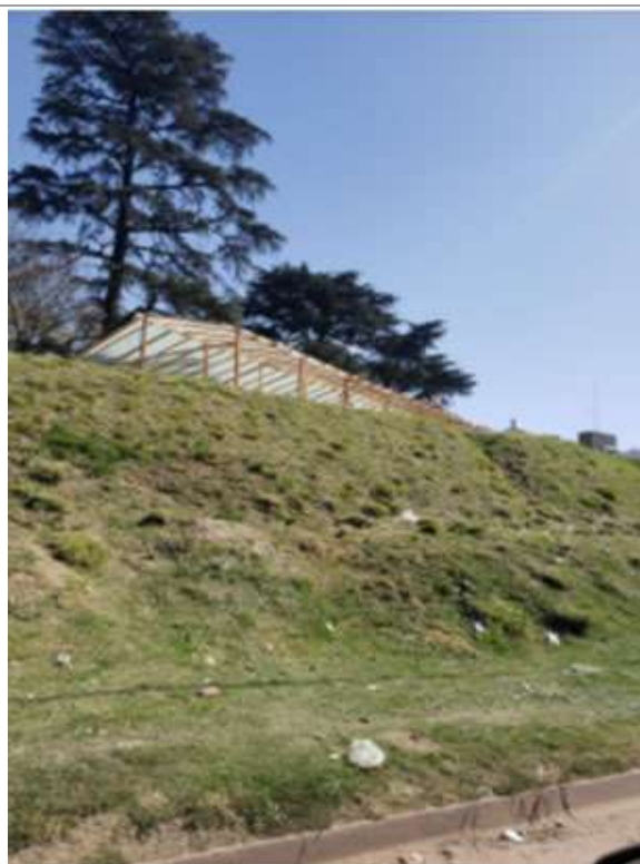
Construcción invernáculos ilegales en terrenos que pertenecen a Museos Históricos. En el fondo se puede ver la torre de la Chacra Los Tapiales